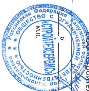
График проведения планово-предупредительных работ котлового и вспомогательного оборудования котельной,

находящейся по адресу: г. Обнинск, ул. Усачёва, д. 21,